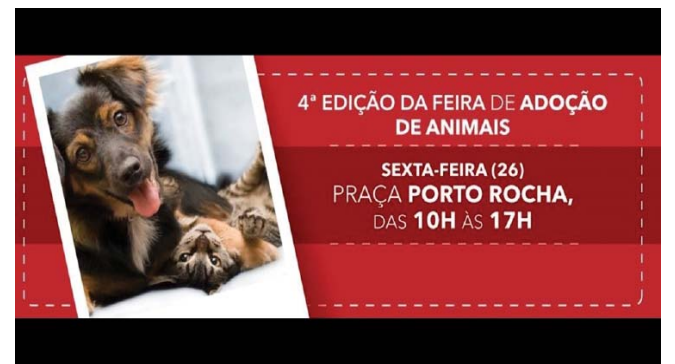
Portal da Prefeitura de Cabo Frio