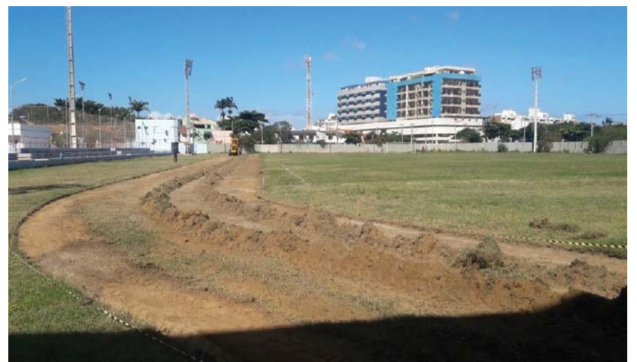
Portal da Prefeitura de Cabo Frio