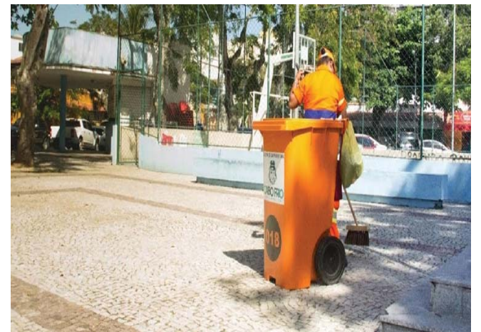
Portal da Prefeitura de Cabo Frio

Os trabalhadores varrem e depositam o lixo em sacolas de 200 litros, que em seguida são recolhidas por uma caminhonete. O lixo acumulado nas lixeiras dos postes também é recolhido. Por dia são retirados cerca de 17 mil quilos de lixo destes locais.