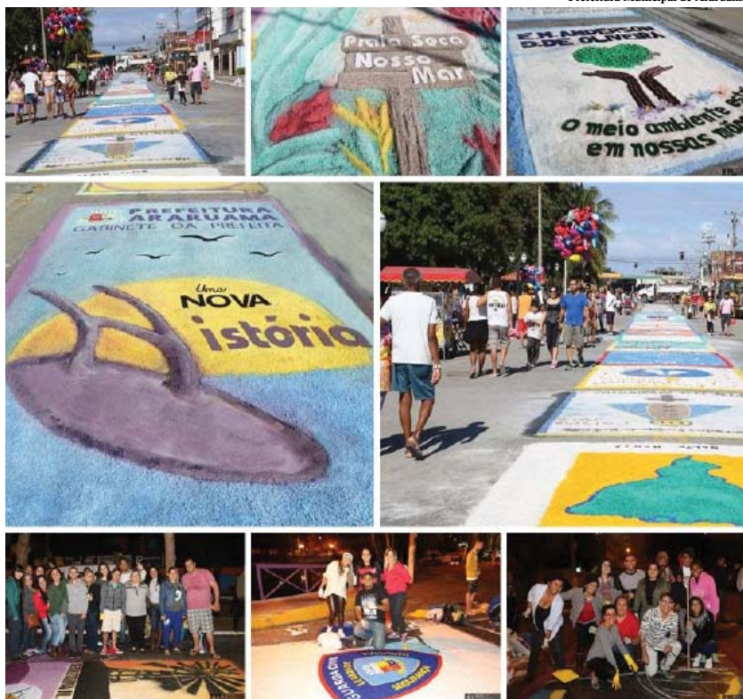
Prefeitura Municipal de Araruama

Assessoria de Comunicação Social Prefeitura Municipal de Araruama