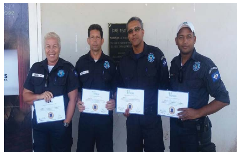
Prefeitura de Cabo Frio