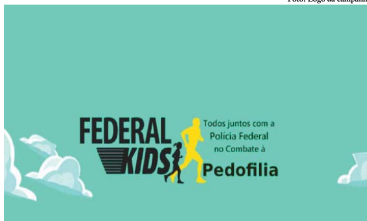
Foto: Logo da campanha

A Corrida e a Caminhada Federal Kids, organizada pela Polícia Federal (PF), terá uma edição especial em Macaé. O evento de conscientização e combate à pedofilia será em setembro. A programação contará com simpósio para capacitar professores e conselheiros tutelares sobre como prevenir a pedofilia. Este encontro jurídico envolverá as polícias Militar, Civil, Federal, o Ministério Público (MP), a Ordem dos Advogados do Brasil (OAB) e agentes da Assistência Social. Haverá apresentação do tema, esclarecimento de dúvidas e análise de casos. Informações sobre local e horário do evento serão divulgados mais próximo da data de realização. Pág 04