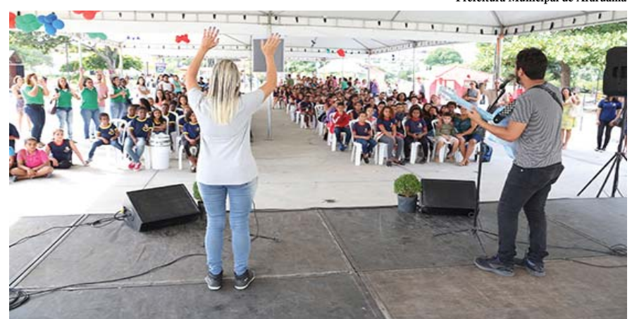
Prefeitura Municipal de Araruama

O evento foi um sucesso, contando com a exposição de stands, distribuição de mudas, oficina de reciclagem, jogos interativos, além de produtos oriundos da Agricultura Familiar e Apicultura. Na ocasião, houve diversas apresentações musicais, além de Exposição das Fotos do Concurso de Fotografia entre as escolas da Rede