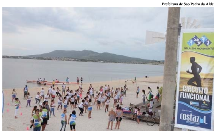
Prefeitura de São Pedro da Aldeia

A população de São Pedro da Aldeia pode fazer atividades físicas gratuitas em dois projetos. As inscrições permanecem abertas o ano inteiro.