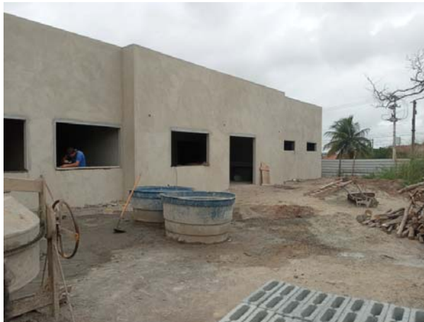
Fig. 01: Fachada Principal