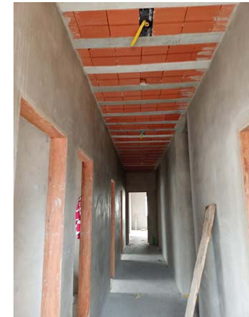
Fig. 02: Circulação Interna.